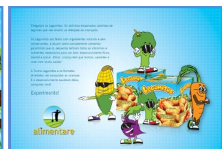
Take one - verso