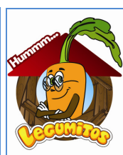
Adesivo de chão