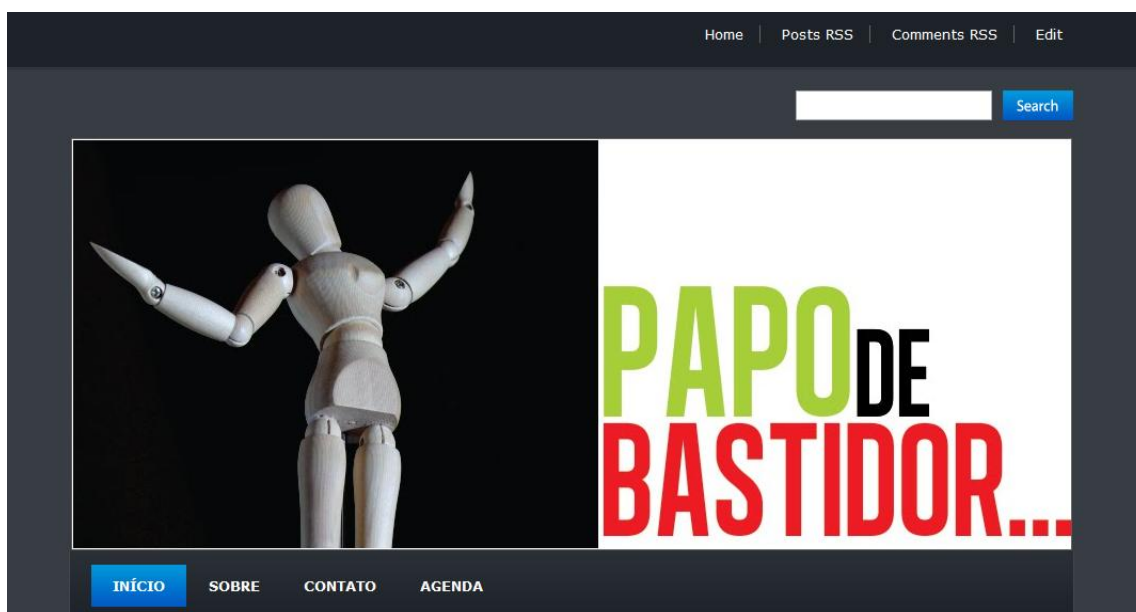
Figura 01: Reprodução da logomarca do blog “Papo de Bastidor”

A escolha de cada detalhe do blog foi feita de acordo com o seu público-alvo. Desde a opção pelo nome “Papo de Bastidor”, jargão do meio teatral que indica “conversa informal”, até a eleição da cor do plano de fundo. Importante destacar que o planejamento teve como objetivo proporcionar uma leitura agradável e limpeza visual da página. O cabeçalho foi criado para não ser óbvio e, ao mesmo tempo, ser entendido facilmente. A opção por um ator de madeira engloba gêneros e pode ser assimilado pelos diferentes leitores, processo de identificação almejado pela marca do blog. A disposição das palavras que formam o nome, bem como as cores vibrantes e o tamanho, trazem sutileza e quebram a monotonia do fundo cinza.