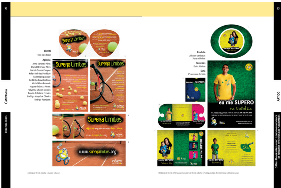
FIGURA 3 - Página dupla de campanha