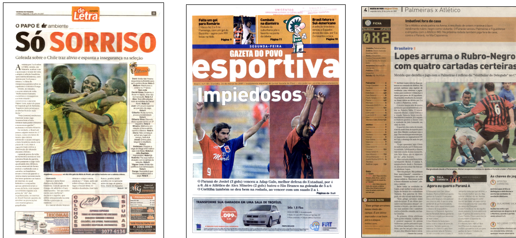
Modelos das páginas esportivas da Tribuna (esquerda) e da Gazeta do Povo Esportiva (ao centro e à direita)