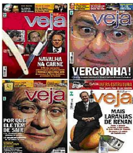
Quadro 1 – Capas das edições da VEJA sobre o Caso Calheiros.

O político é apresentado iconicamente enquanto figurão do Senado, o que é destacado pela fotografia da cadeira da Presidência e por seus trajes formais e cenários oficiais. Suas expressões faciais destacam, na maioria das fotografias, o conforto em se ocupar de tal cargo e, às vezes, a apreensão de estar sob suspeita.