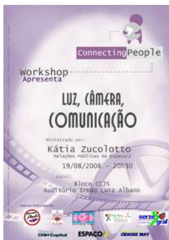
Figura 3. Cartaz e flyer

No processo de divulgação e marketing, foi difundida a marca do evento por cartazes e flyers posicionados estrategicamente dentro da universidade. Foram espalhados os cartazes por toda a extensão do Centro de Ciências Jurídicas e Sociais – CCJS, e os flyers entregues nas salas de aula do público-alvo. Foi desenvolvido um banner para identificar o local.