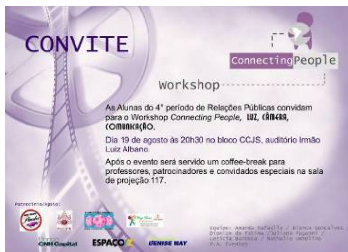
Figura 5. Convite

Por serem formais, os convites foram entregues apenas para convidados especiais. Os quais estavam convidados também para o coffee-break.