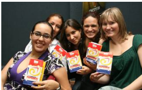
Alunas do 2º ano de Relações Públicas posam para foto com a marca do patrocinador