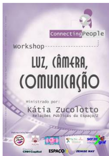
Figura 4. Banner

Por serem formais, os convites foram entregues apenas para convidados especiais. Os quais estavam convidados também para o coffee-break.