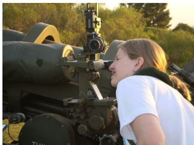
Acima, aluna da Unicentro confere detalhes de uma das peças de artilharia.

Abaixo, parte da equipe se preparando para o embarque rumo a Três Barras (SC)