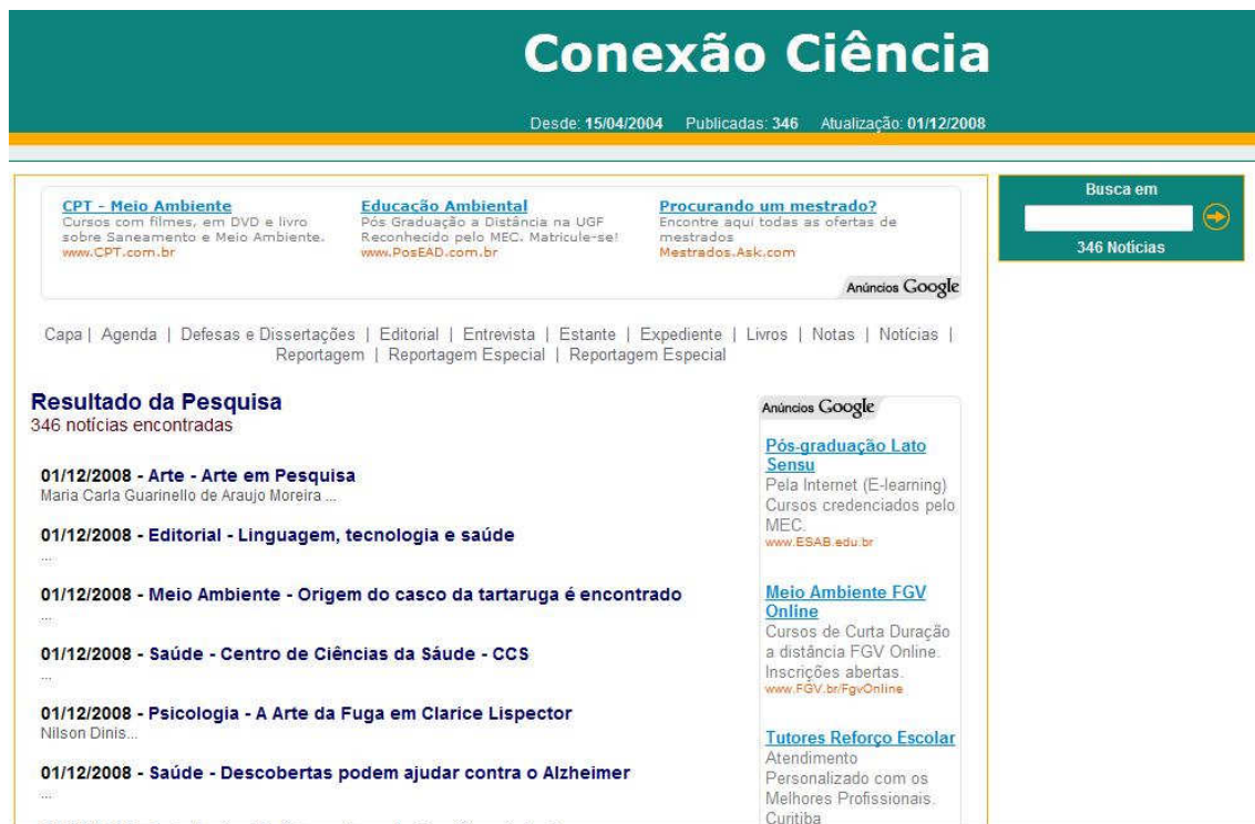
Figura 3 – Ferramenta de busca

Para matérias anteriores, que não estejam na página inicial, é possível acessar a ferramenta de buscas.